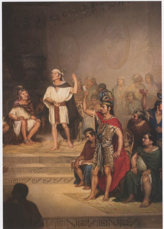
García Martínez estudió cómo parte de la organización política de las sociedades mesoamericanas pervivió después de la conquista española y se mantuvo en la época colonial. OBRA DE RODRIGO GUTIÉRREZ, EL SENADO DE TLAXCALA , 1875, ÓLEO SOBRE TELA. MUSEO NACIONAL DE ARTE, SECRETARÍA DE CULTURA. INBA.MX

Una peculiaridad de la disciplina histórica, a diferencia de muchas otras, es que no tiene un objeto de estudio definido y son los propios historiadores quienes eligen su campo de investigación y especialidad. Así, hay quienes estudian a los personajes más encumbrados de una época o sociedad; quienes se dedican a examinar los “grandes episodios” de la historia nacional (su fundación, su expansión, su caída, su colonización, su independencia, sus momentos revolucionarios, sus grandes reformas, etcétera); quienes eligen investigar las historias de las ciencias, la tecnología, las artes y las humanidades; quienes prefieren estudiar los grandes procesos y estructuras de la sociedad, la política, el ejército, la Iglesia, la economía, las creencias, la cultura y el pensamiento humano; quienes se han dedicado